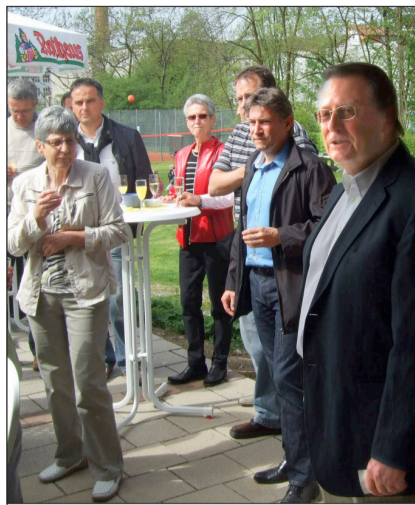
ERÖFFNET wurde die Saison beim TC Wehr. Die Tennisspieler haben sieben Mannschaften und drei Jugendmannschaften gemeldet, die an den Medenspielen teilnehmen. Die Damen 30 werden den Club in der Oberliga vertreten.